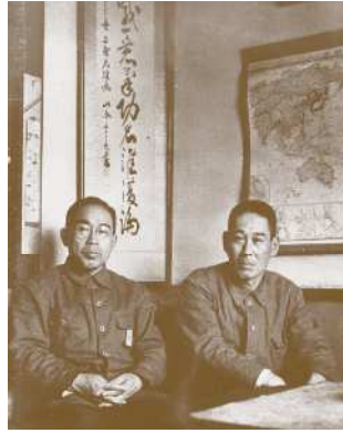
1943年 本社事務所 (山本五十六元帥書の前)