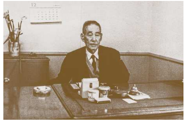
1965年 会長執務室にて