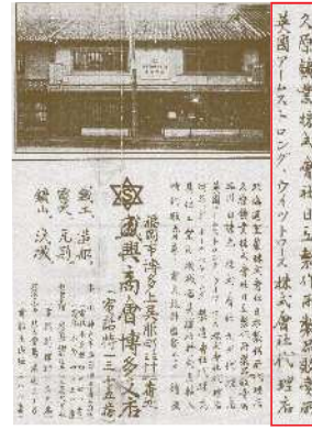
1917年当時の福岡市案内広告