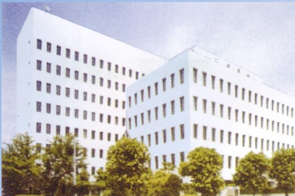
Seiko Electric Group Head Office (Fukuoka, Japan)