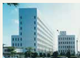
本社別館ビル竣工