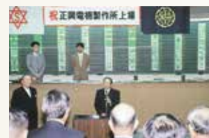
福岡証券取引所株式上場