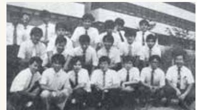
ソフトウェア要員 (株)日立製作所派遣