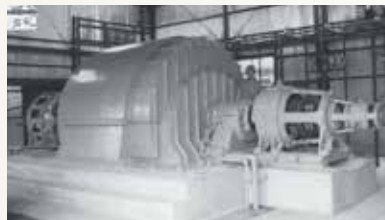
遮断試験設備完成