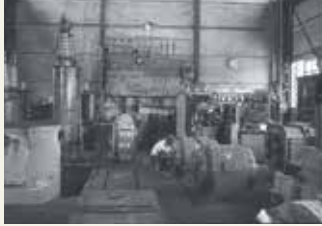
昭和30年当時の修理工場