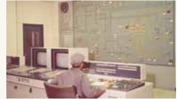
九州電力(株) 嘉穂制御所 集中制御システム初納入