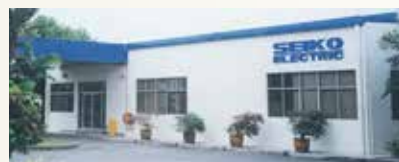
正興エレクトリック アジアマレーシア設立