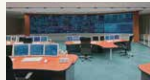
九州電力(株)北九州支店 新総合制御所システム運用開始