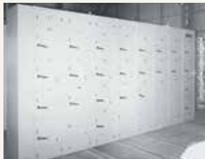
九州電力(株)小倉発電所納入の コントロールセンタ