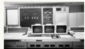
九州電力(株) 小倉営業所 配電線自動制御システム初納入