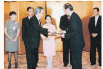
アジアソリューション フィリピン設立