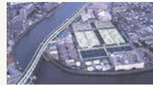
東京都下水道局へ電機設備納入 (小台処理場)