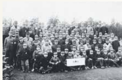
昭和18年当時の糸島工場