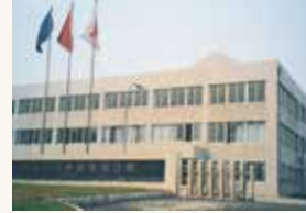
大連正興開関有限公司設立