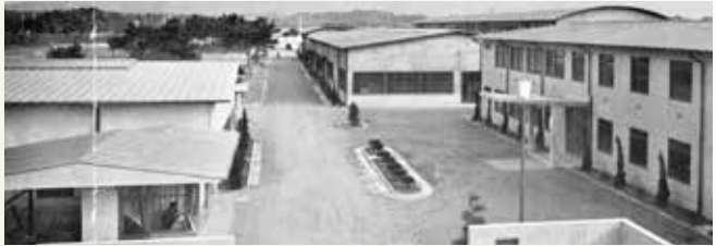
昭和35年 古賀工場新設