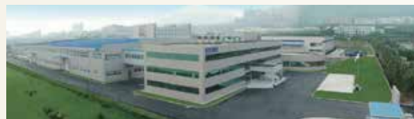
大連正興電気制御有限公司 新工場竣工