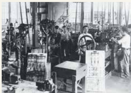
昭和13年当時の堅粕工場