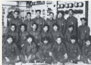
昭和8年 岩田屋納入低圧盤の前にて