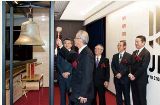
東京証券取引所市場第二部上場