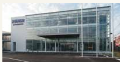
古賀事業所Lサイト・Rサイト建設